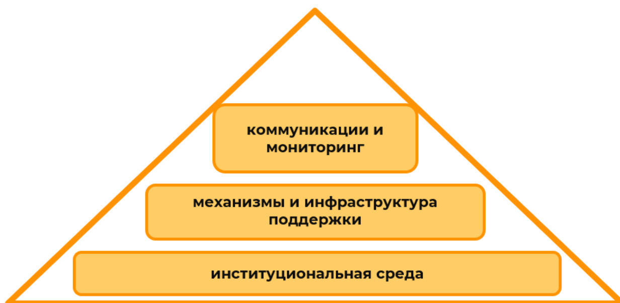
Рисунок 1 – Модель поддержки социального предпринимательства

На рисунке 1 показаны компоненты предлагаемой Модели поддержки социального предпринимательства.